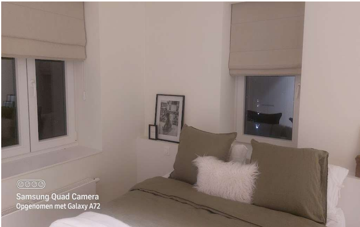
📷 Samsung Quad Camera Opgenomen met Galaxy A72